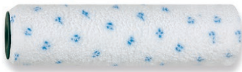
Wałek mikrofibra RotaStar

PREPARATY DO DREWNA – ponieważ są to rzadkie materiały, najlepszym rozwiązaniem będzie wałek mikrofibra , np. RotaStar, który absorbuje nawet 6-krotnie więcej farby, niż jego własna objętość.