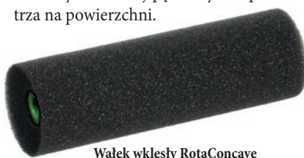
Wałek wklęsły RotaConcave